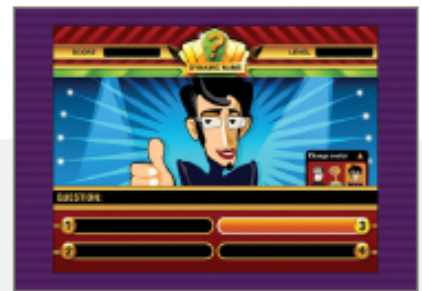
Samples of Composica Mind Games

Programming-free, web-based and easy-to-use, Composica Enterprise is everything you need to maximize course creativity and learner performance.